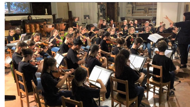
I premio assoluto al Concorso Nazionale "Zangarelli" di Città di Castello 2018