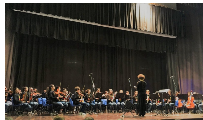
Concerto di fine anno e premiazioni delle borse di studio al "Teatro Remondini"

"Il suono musicale ha accesso diretto all'anima e vi trova subito una risonanza, poiché l'uomo ha la musica in sé stesso"